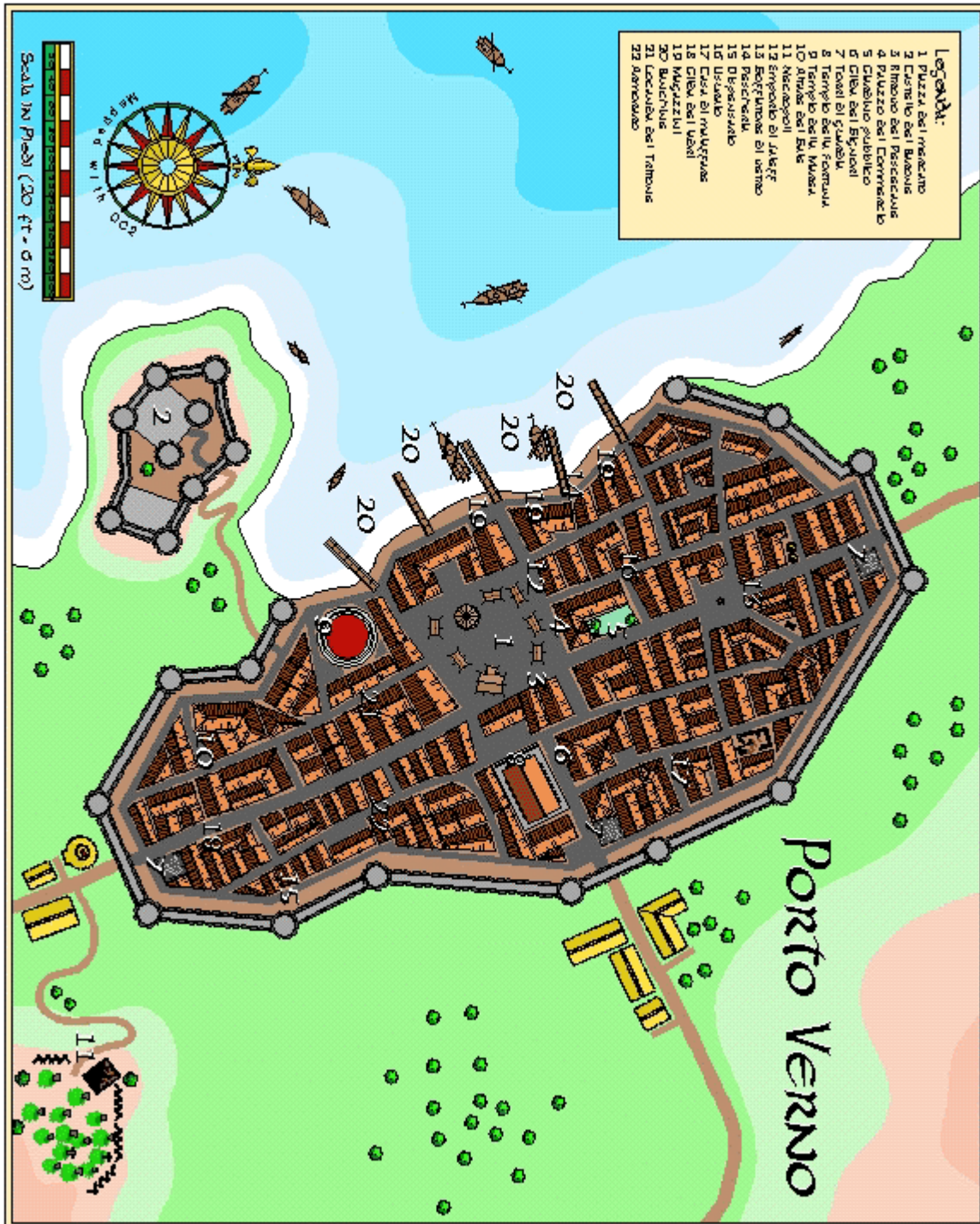
Mappa di Porto Verno